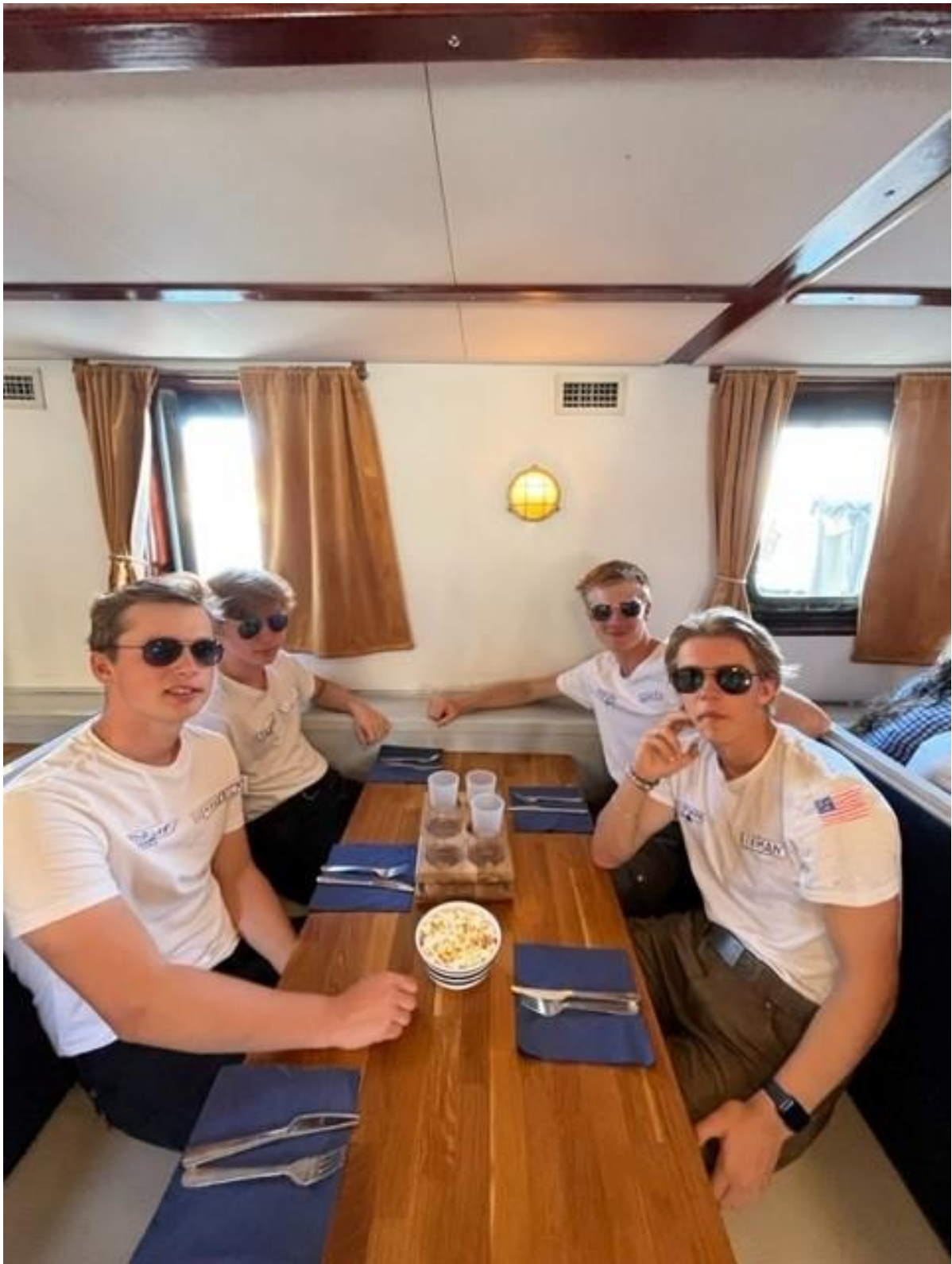
Maverick, Slider, Goose och Iceman