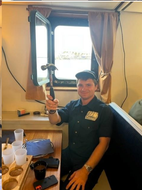
Lilla My, Spöket Laban, Den galne hattmakaren, Alice i underlandet och fixar-Felix