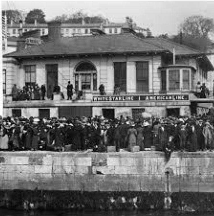
Amerikalinjens samlingshall på Great Island Cobh då och nu

Nu sätter vi segel för att stötta upp Älva och siktar över det keltiska havet.