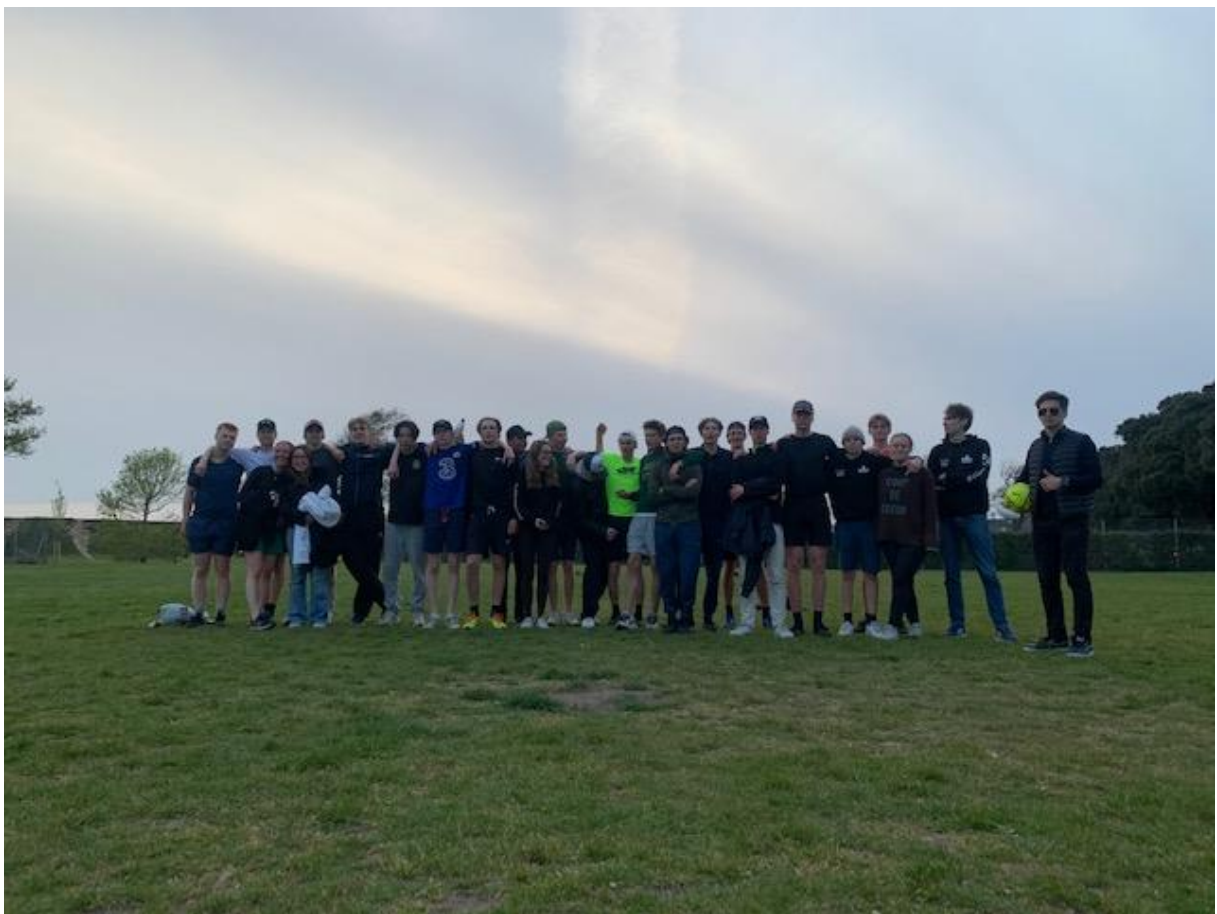
Ett taggat fotbollsgäng!