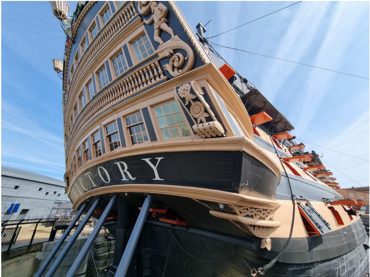
HMS Victory's aktergalleri. Fartyget sjösattes 1765 och deltog i napoleonkriget och slaget vid Trafalgar 1805.