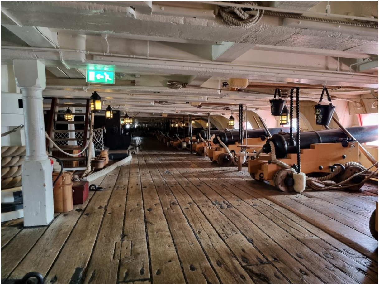
Ett av alla kanondäck.