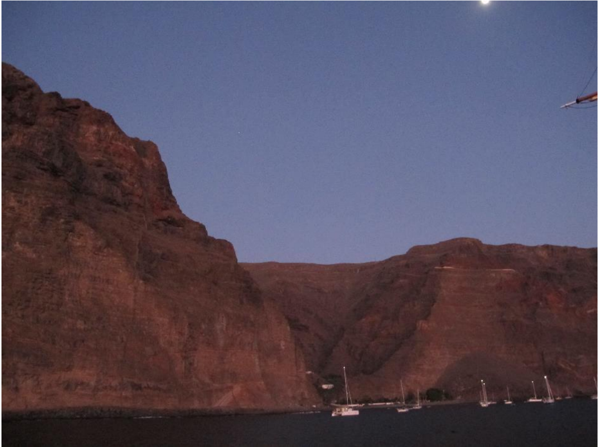
De spektakulära bergen vid hamnen i Valle Gran Rey