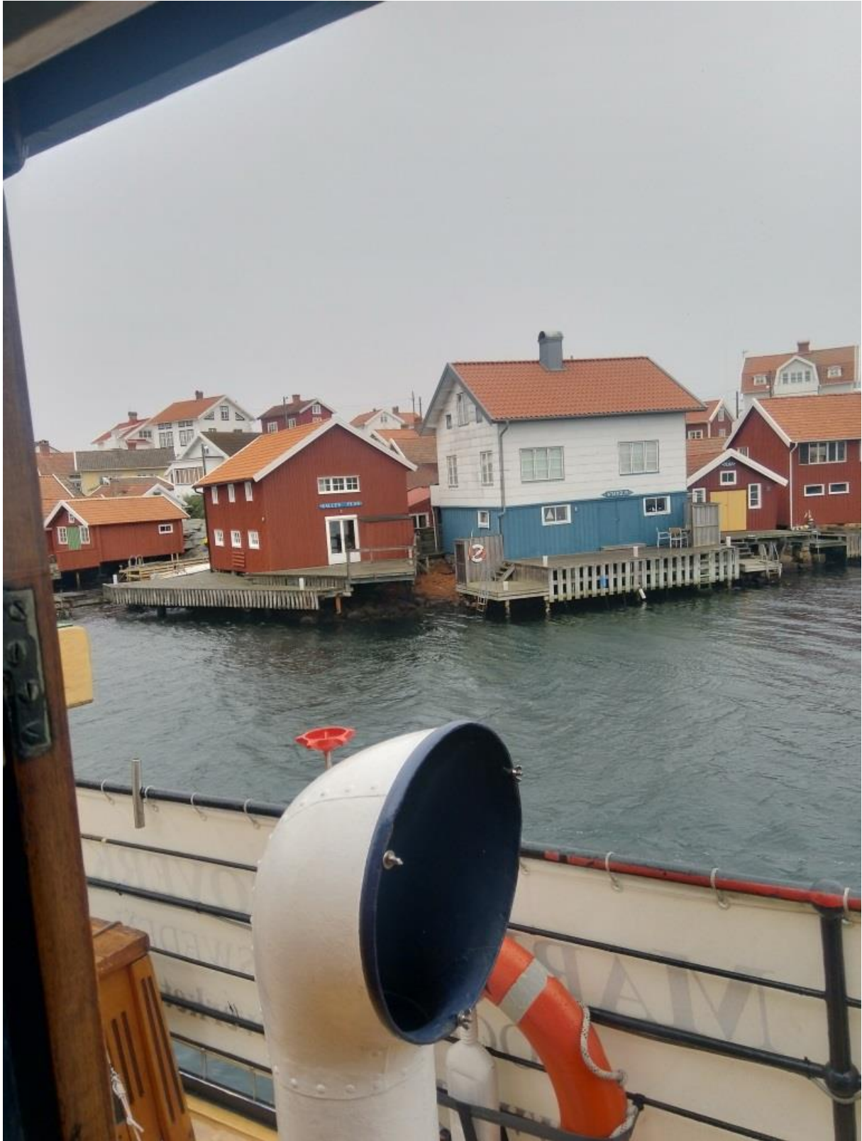
Vi passerar Gullholmen