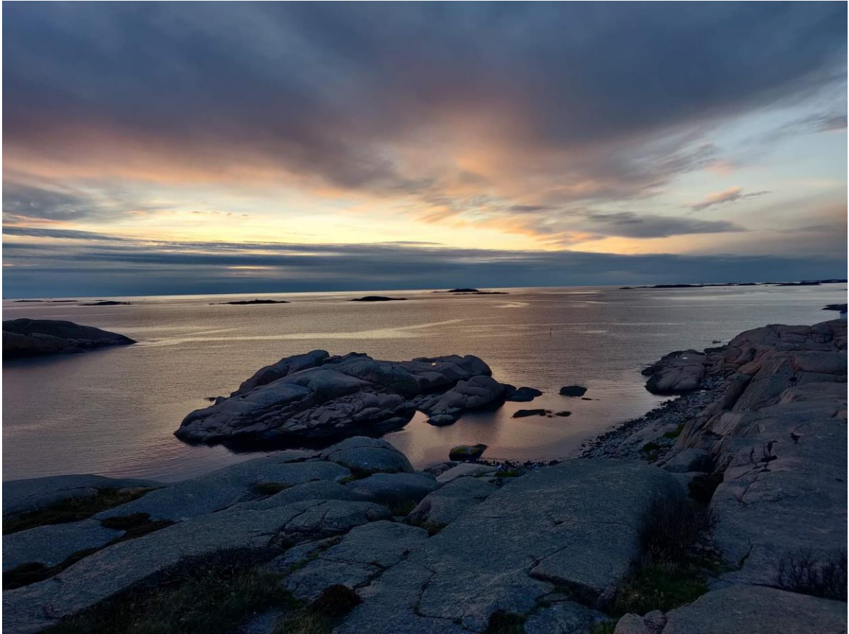
Solnedgång över Stångehuvud