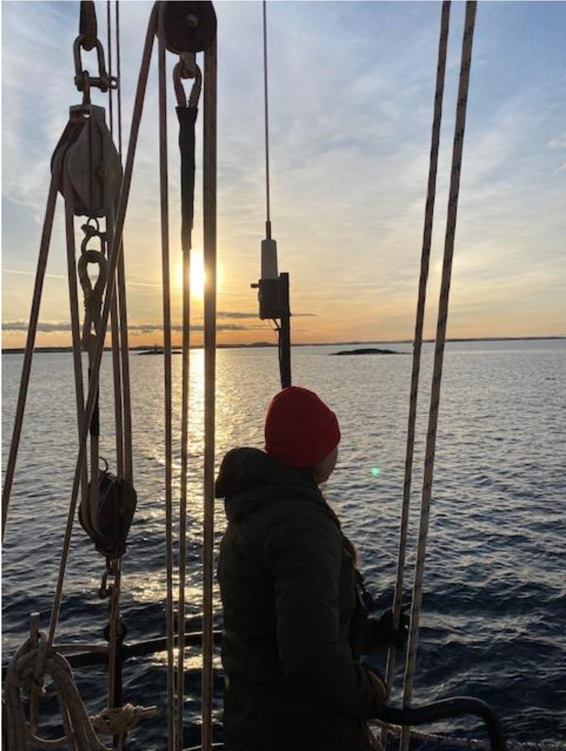
På utkik efter fiskebojar