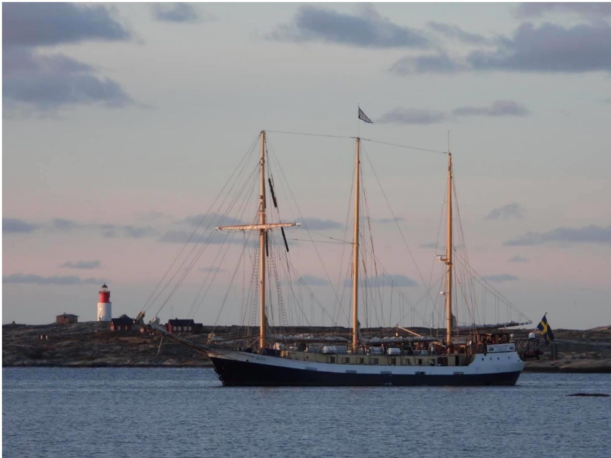
Vi glider ut förbi Hållö...