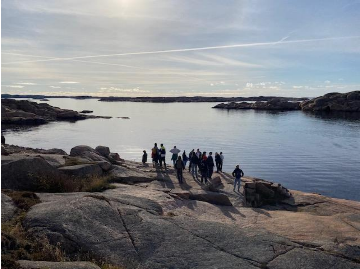
Stilla väder vid Stångehuvud