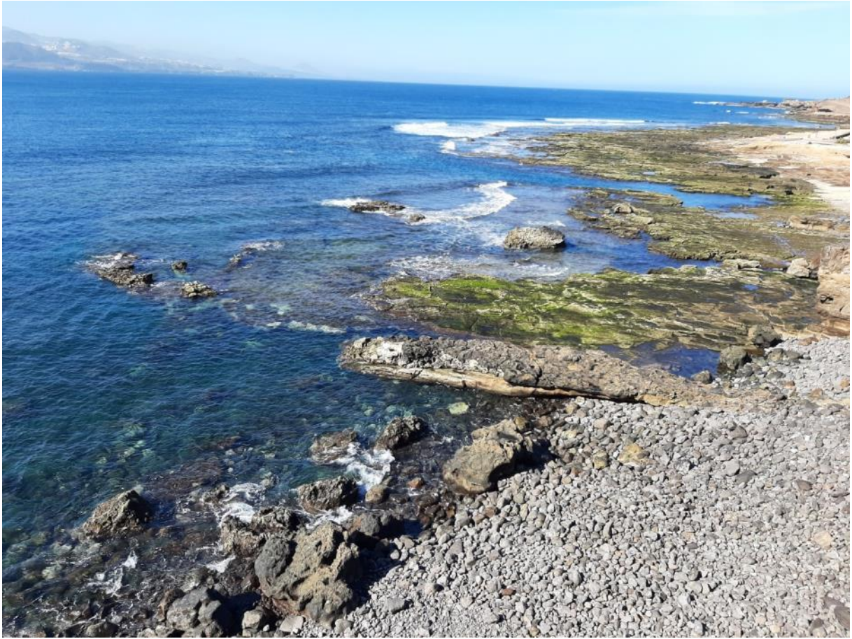
Bild 3: Exkursionsområdet ovanifrån. Stenarna längst ut till vänster på bilden var helt torrlagda vid lågvatten.