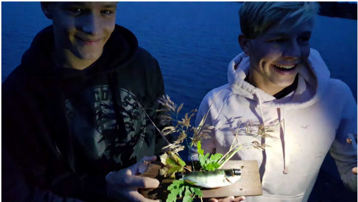
En installation till kvällens redovisning