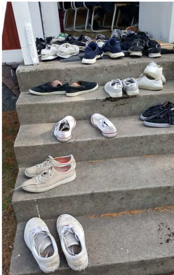
Enklast att hålla rent med skorna utanför