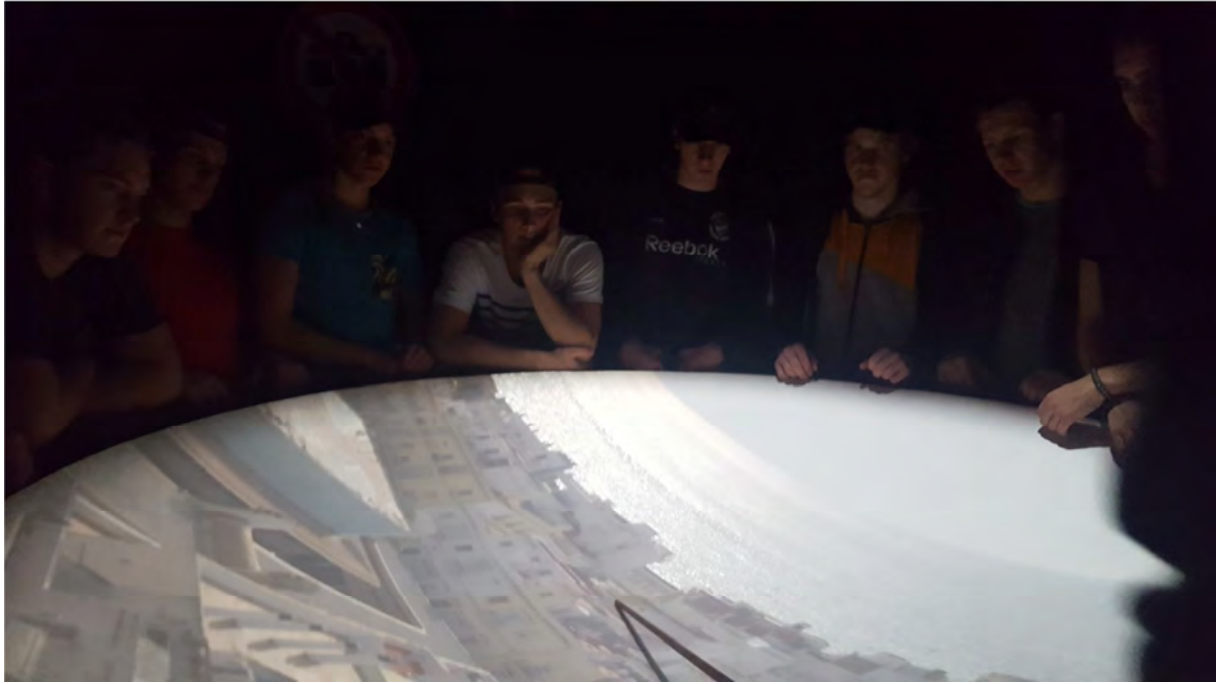
...avgång från Cadiz