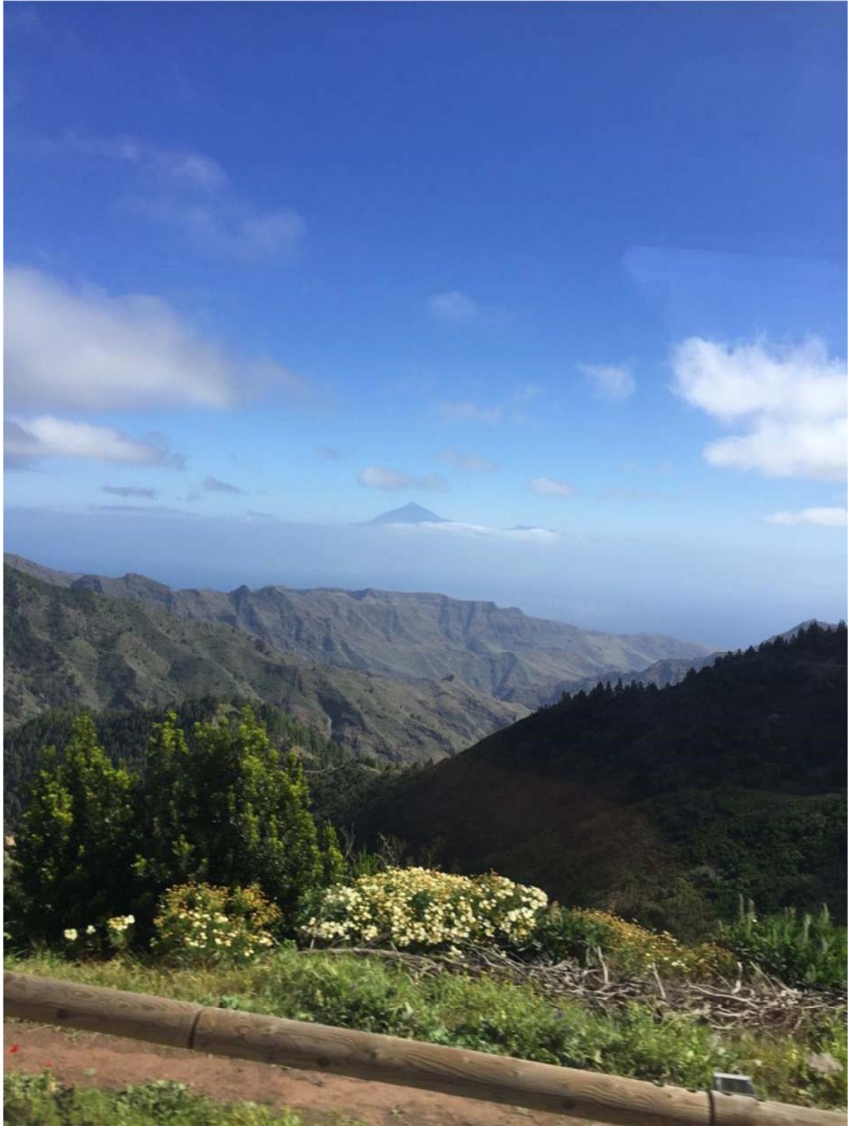
Teide och Teneriffa i fjärran, endast 22 km från La Gomera med båt.