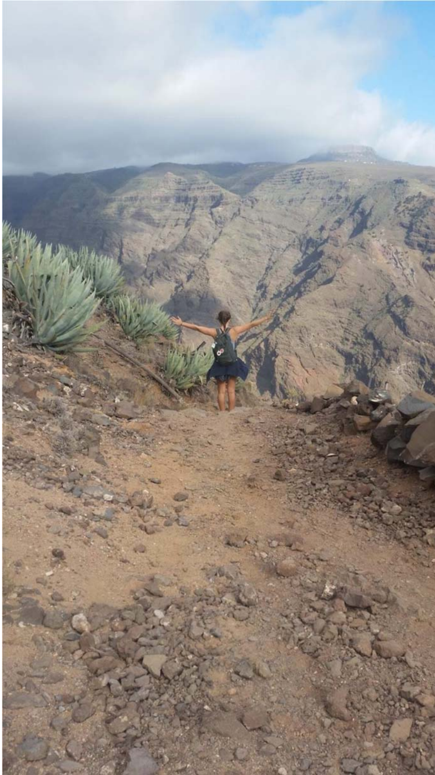
Bergen på La Gomera gjorde vandringen till ett riktigt äventyr.